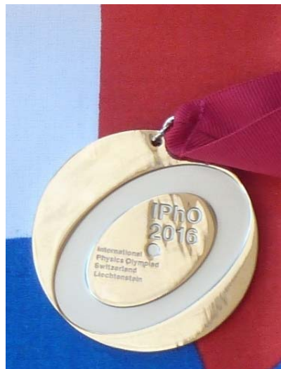
Obr. 2 - Strieborná medaila